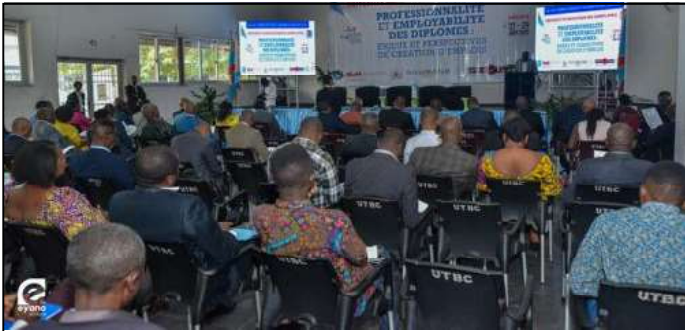
Colloque sur l'emploi des jeunes à l'université technologique Bel Campus.

nommée " RAREC ", ils ont lancé cet appel à Kinshasa lors d'un colloque sur le développement de la RDC.