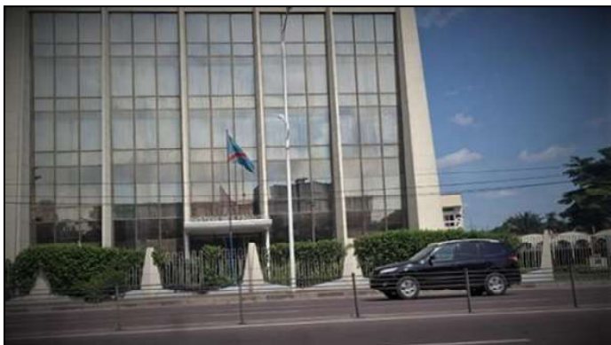
Le bâtiment du Ministère des Finances sur le boulevard du 30 juin à Kinshasa.

182,25 millions de dollars américains alors que les prévisions des crédits en faveur de la première institution du pays ont été fixés à 285,4 milliards CDF soit 142,7 millions USD. Idem pour l'Assemblée nationale dont les dépenses ont été chiffrées à hauteur de 51,7 milliards CDF, montant équivalent à 25,85 millions USD. Ce rapport démontre, si besoin en était encore, que la tendance des dépenses liées au fonctionnement et à la rémunération est demeurée en hausse les deux dernières années.