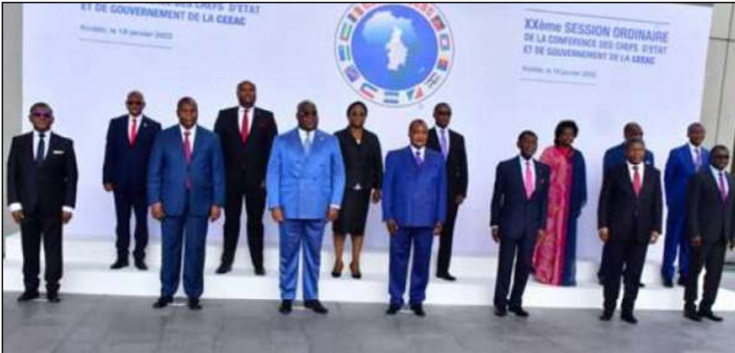
Photo de clôture de la XX e Session ordinaire de la Conférence des chefs d'Etat et de gouvernement de la CEEAC le 19/01/2022 à Brazzaville.

De l'examen de tous ces points à l'ordre du jour, il ressort que la situation politique et sécuritaire globale en Afrique centrale, au cours de la période comprise entre janvier et juillet 2022, est restée stable, indique la CEEAC. Néanmoins, la région continue à faire face à plusieurs défis sécuritaires, notamment le terrorisme et l'extrémisme violent, l'activisme des groupes armés et des mouvements sécessionnistes, les conflits intercommunautaires, l'impact négatif de la guerre russo-ukrainienne ainsi que l'impact négatif de la crise sanitaire causée par la pandémie de la Covid-19.