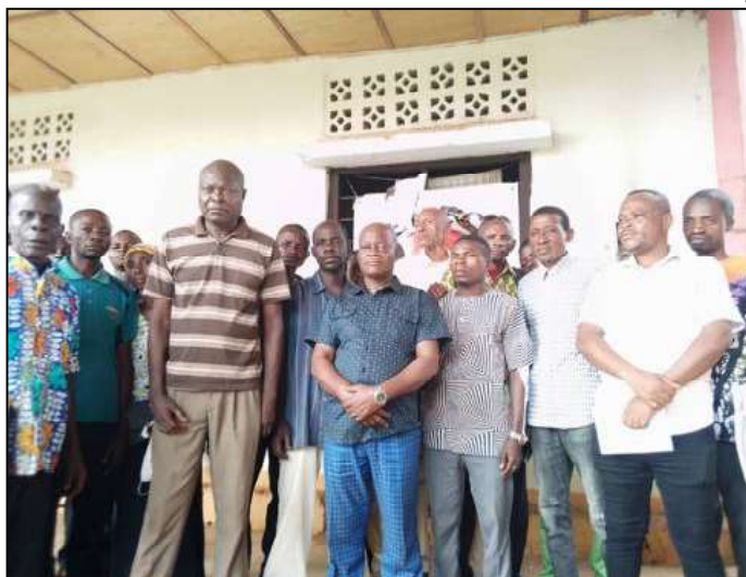
Les membres de la synergie des syndicats des enseignants de l'EPST Kwilu 1 après une assemblée extraordinaire pour boycotter la rentrée scolaire 2021-2022 à Bandundu ville.