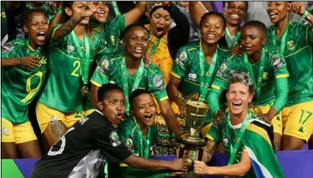
L'Afrique du Sud, championne d'Afrique pour la première fois de son histoire. Le 23 juillet 2022.

Falcons que les Banyana Banyana avaient en face d'elles en finale de la CAN 2022, mais les Marocaines. Des Nord-Africaines qui les ont bousculées durant une première période assez fermée.