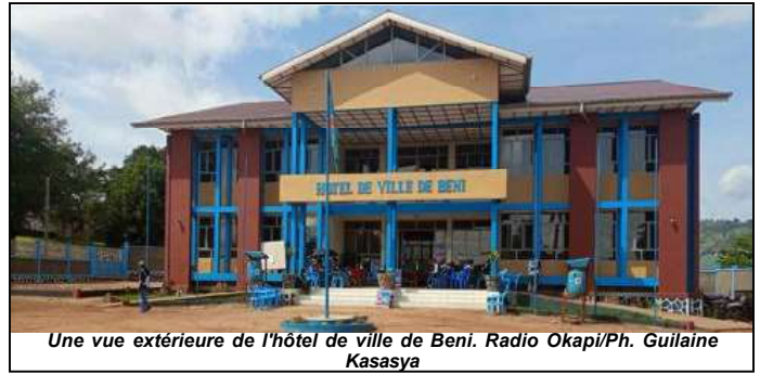
Une vue extérieure de l'hôtel de ville de Beni.