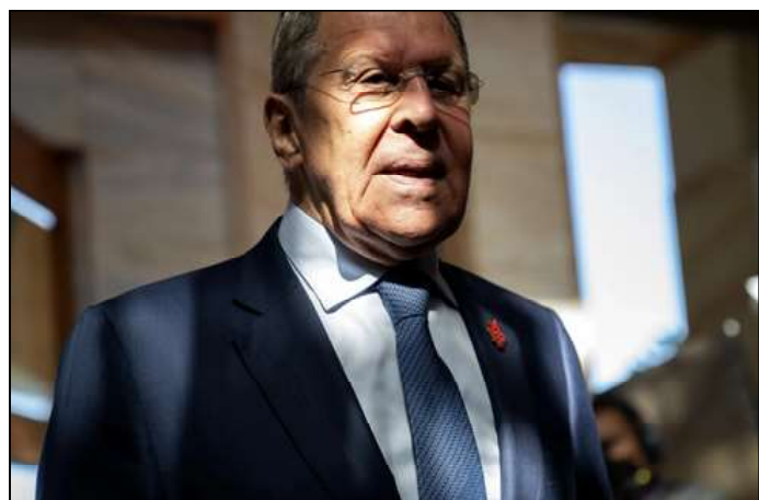
Sergueï Lavrov, ministre russe des Affaires étrangères, le 8 juillet 2022.

en terre congolaise, l'avion de Sergueï Lavrov s'est posé sur l'aéroport d'Ollombo, près d'Oyo, le dimanche à 20h15', heure locale. Il venait du Caire, où le chef de la diplomatie russe a commencé sa tournée africaine.