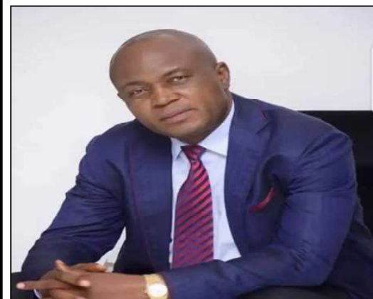
Gentiny Ngobila Mbaka, gouverneur de la ville-province de Kinshasa.

clistes à l'ordre au cours d'une réunion qu'il a tenu avec les associations et les responsables des motocyclistes de la ville de Kinshasa dans la salle polyvalente de l'Hôtel de ville.