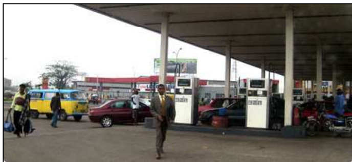
Le gouvernement veut aller en guerre contre la prolifération des stations-services et l'occupation anarchique des servitudes (Illustration).

érigés à côté des habitations. " Le secteur des hydrocarbures est régi par la loi de 2015 et le décret de 2016. Nous avons discuté avec le ministre d'Etat en charge de l'Urbanisme et habitat sur cette question et nos équipes seront déployées sur le terrain à partir de la semaine prochaine. Les stations-service qui ne répondent pas aux normes seront fermées, et même les dépôts clandestins seront délocalisés. Nous n'allons pas appliquer la loi avec complaisance. Certes, il y a ceux-là qui vont crier, mais nous allons nous nous assumer. Actuellement, certaines stations continuent de fonctionner sans aucun permis, et d'autres sont construites à côté des habitations, ce qui est inad-