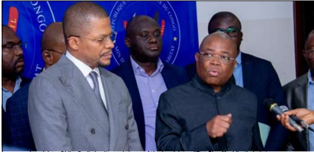
Le ministre Didier Budimbu (à gauche) aux côtés du ministre d'Etat Pius Muabilu (à droite).

respect des normes environnementales et des conditions réglementant le secteur. Une prolifération qui a profondément inquiété le président de la République jusqu'à interpeller le gouvernement face à cette situation déplorable.