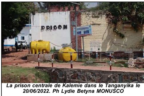
La prison centrale de Kalemie dans le Tanganyika le 20/06/2022.

secouent ce centre pénitentiaire, renseignent-ils.