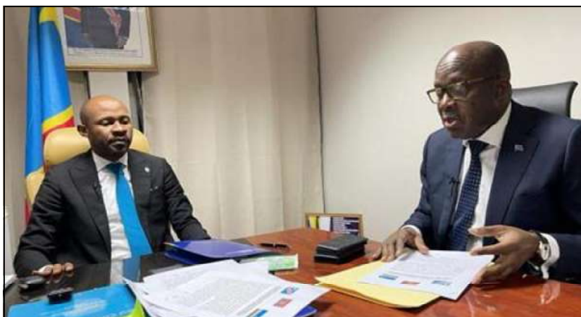
Le ministre des Affaires étrangères, Christophe Lutundula, avant la conférence de presse conjointe organisée avec son collègue de la Communication et des Médias, Patrick Muyaya, le 23/07/2022 à Kinshasa.

tervenue de la Communauté de l'Afrique de l'Est (EAC), qui sera " in-