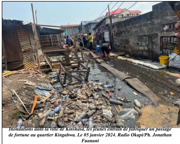
Inondations dans la ville de Kinshasa, les jeunes entraînent de fabriquer un passage de fortune au quartier Kingabwa. Le 05 janvier 2024.

La même source a précisé qu'au vu de l'évolution exceptionnelle du niveau d'eau du fleuve Congo en date du 28 décembre et à l'allure de la remontée des eaux qui rapproche de celle de 1961, ces inondations menacent les activités économiques et les populations riveraines.