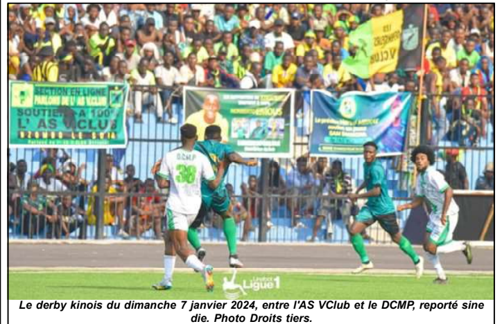
Le derby kinois du dimanche 7 janvier 2024, entre l'AS VClub et le DCMP, reporté sine die.

Cette décision intervient pendant que le DCMP se classe 5 e au classement provisoire du groupe B avec 25