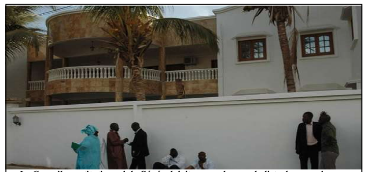
Le Conseil constitutionnel du Sénégal doit se pencher sur la liste des parrainages des candidats à l'élection présidentielle du 25 février.

En cause : la présence sur leur fiche de parrainage de doublons externes, c'est-à-dire de noms qui étaient présents sur la fiche d'un ou plusieurs autres candidats, ainsi que de noms qui ne figurent pas au fichier électoral. Notifiés vendredi, les candidats en question ont jusqu'à 17h ce lundi pour amener la nouvelle liste au Conseil constitutionnel.