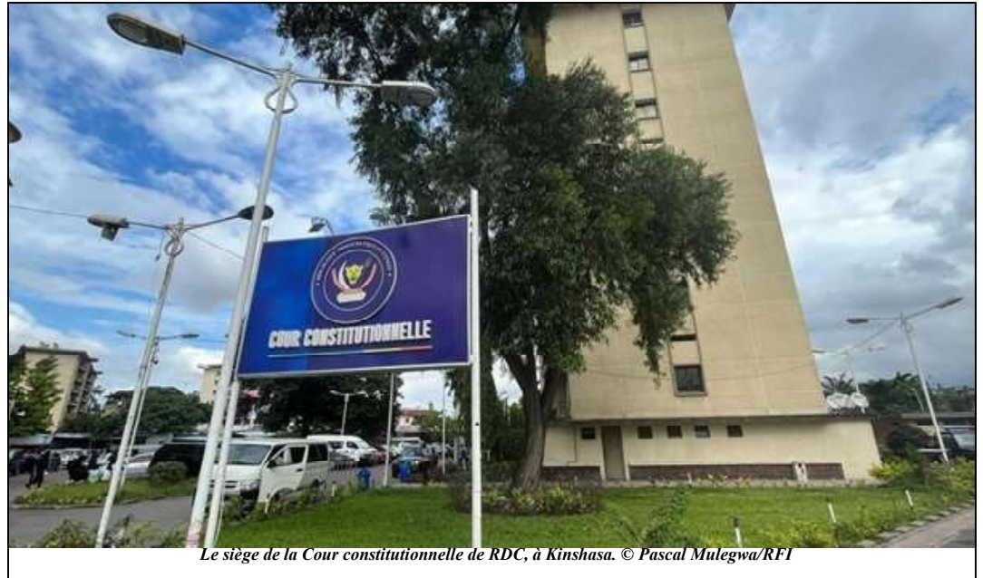
Le siège de la Cour constitutionnelle de RDC, à Kinshasa.

didats députés. Soi-disant, ils possédaient des machines de la Céni dans leur domicile. C'est inexplicable ! Quel dysfonctionnement au sein de la Céni