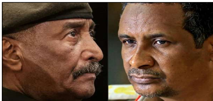
À gauche, le chef des forces armées soudanaises, le général al-Burhan et à droite celui des Forces de soutien rapide, Hemedti.

Pour d'autres, le retard est plus conséquent, c'est le cas de la gynécologue Rose Wardini qui doit régulariser 31 000 noms. Ou encore de l'ancienne Première ministre Aminata Touré avec 19 000 parrains invalidés.