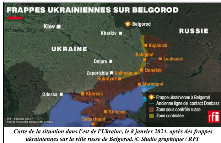
Carte de la situation dans l'est de l'Ukraine, le 8 janvier 2024, après des frappes ukrainiennes sur la ville russe de Belgorod.

une échelle bien moindre, ce que les habitants de Kharkiv vivent depuis près de deux ans, avec des bombardements russes quasi-quotidiens. Belgorod-Kharkiv : ces deux villes partagent une longue histoire.