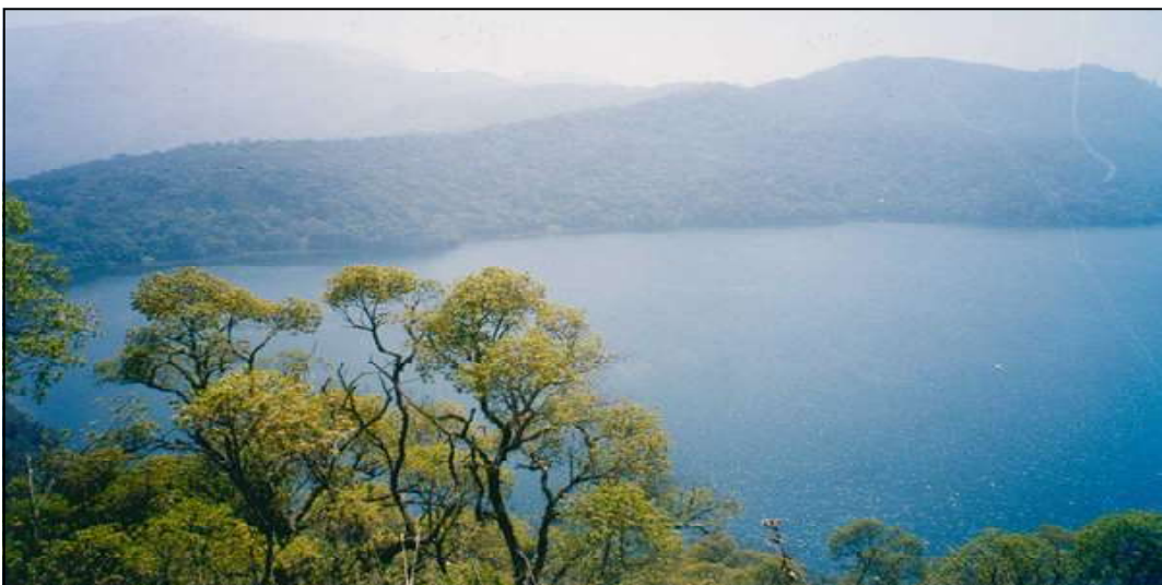
Lake Oku, in Cameroon's North-West region, where conservation efforts are being improved.