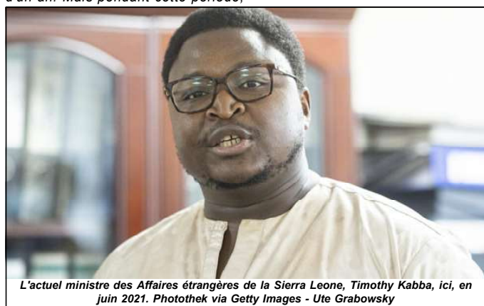
L'actuel ministre des Affaires étrangères de la Sierra Leone, Timothy Kabba, ici, en juin 2021.

Mais le processus lui-même exige que tout pays désireux de se retirer doit exprimer formellement sa demande auprès de la Cédéao et qui sera ensuite examiné dans un délai