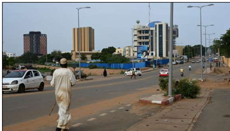
[Image d'illustration] Vue générale d'une rue de Niamey le 8 septembre 2023.

29 janvier à Niamey, une délégation conduite par le ministre togolais de l'Administration territoriale a été reçue par les autorités de transition. Il n'a pas été indiqué si cette discrète rencontre, dont le contenu des discussions n'a pas été dévoilé, est à l'initiative de la Cédéao ou du seul état du Togo.