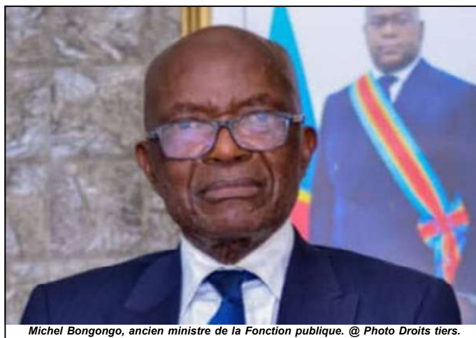
Michel Bongongo, ancien ministre de la Fonction publique.

4? vice-président de l'AAAP chargé de la Communication.