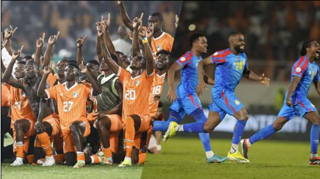
La Côte d'Ivoire (à gauche) et la RDC (à droite) se sont qualifiées pour les quarts de finale de la CAN 2024.

cru égaliser en propulsant le ballon dans les filets juste avant le temps additionnel (90e). Mais sa joie a été de courte durée puisque l'arbitre a immédiatement annulé son but pour un hors-jeu évident, scellant le score du match et la victoire des Maliens. Avec cette qualification en quarts de finale, les Aigles réalisent leur meilleur parcours en Coupe d'Afrique des nations depuis leur troisième place obtenue en 2013. Ils affronteront la Côte d'Ivoire, complètement relancée dans la compétition après son exploit face au Sénégal, pour une place dans le dernier carré.