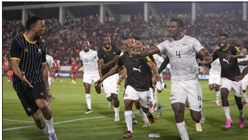
Les joueurs sud-africains célèbrent leur deuxième but lors du huitième de finale entre le Maroc et l'Afrique du Sud à San Pedro, le 30 janvier 2024.

le 30 janvier au stade Laurent Pokou de San Pedro. Après cette victoire contre l'un des grands favoris de la compétition, les Sud-Africains affronteront le Cap-Vert lors du prochain tour.