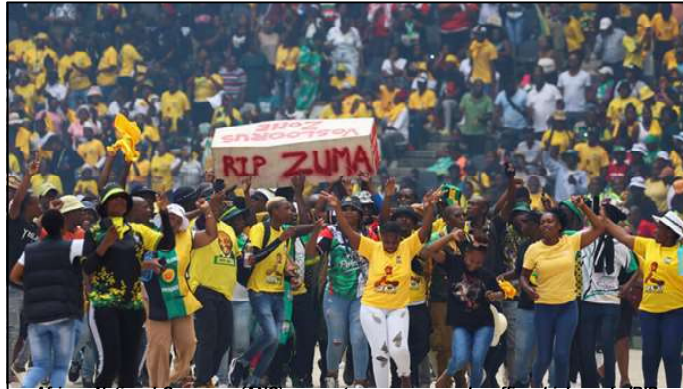
African National Congress (ANC) supporters carry a mock coffin which reads 'RIP ZUMA' during the 112th anniversary celebrations of the founding of the party, at Mbombela Stadium in Mpumalanga province, South Africa, January 13, 2024.

Spear of the Nation In December, he declared that he