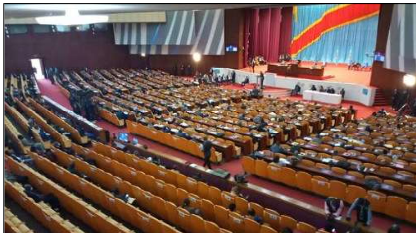
[illustrations] Plénière de l'Assemblée nationale, vendredi 22 janvier 2021 au Palais du peuple, sur l'examen du projet de loi autorisant la ratification de l'accord sur la zone de libre-échange continentale africaine.

mettre à ce que nos services de sécurité puissent remettre la paix et la quiétude en province du Nord-Kivu ", a-t-il expliqué.