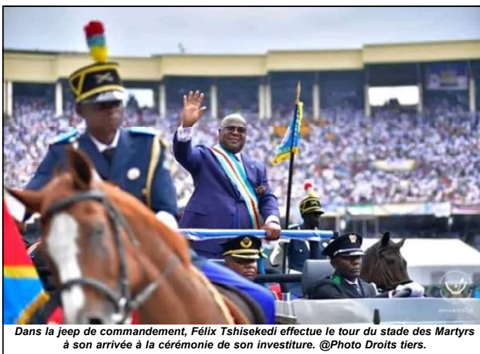
Dans la jeep de commandement, Félix Tshisekedi effectue le tour du stade des Martyrs à son arrivée à la cérémonie de son investiture.

plus pour le gouvernement. Mais, au contraire, une enveloppe de 41 627