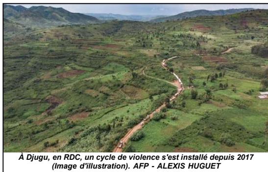
À Djugu, en RDC, un cycle de violence s'est installé depuis 2017 (Image d'illustration).

acres de quinze civils à Djugu, dans la province de l'Ituri, les familles des victimes ainsi que l'association Enté qui regroupe la communauté Hema, ont porté plainte devant la justice.