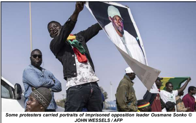
Some protesters carried portraits of imprisoned opposition leader Ousmane Sonko

recommended holding the elections on June 2. Sall indicated that he would