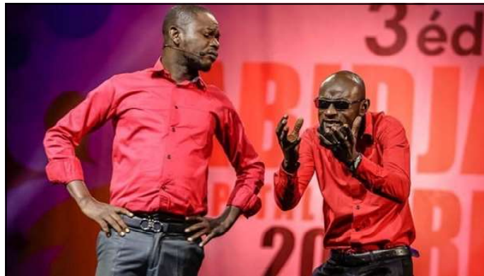
The Zinzins de l'art, winners of RFI's Talent du Rire prize in 2018. Abidjan capitale du rire