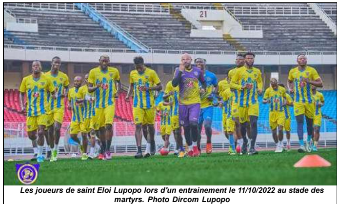
Les joueurs de saint Eloi Lupopo lors d'un entraînement le 11/10/2022 au stade des martyrs.

La première journée de la phase de play off de la LINAFOOT, dans le cadre de la première journée de la phase de play off de la LINAFOOT, s'est poursuivie le dimanche 03 mars