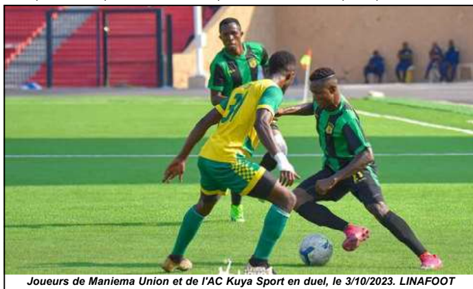
Joueurs de Maniema Union et de l'AC Kuya Sport en duel, le 3/10/2023.

L'Association sportive Maniema Union de Kindu a battu l'Association sportive Dauphin noir de Goma (2-