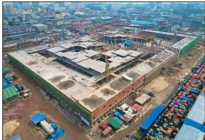
Vue aérienne des travaux de reconstruction du Marché central de Kinshasa

pavillons, a affirmé samedi 02 mars, le gouverneur de la ville province.