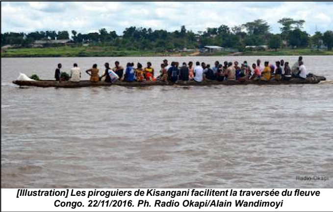
[[Illustration] Les piroguiers de Kisangani facilitent la traversée du fleuve Congo. 22/11/2016.

d'une pirogue à pagaie en amont du fleuve Congo au niveau de la commune riveraine de Lubunga à Kisangani (Tshopo). La plupart de victimes sont des femmes et des enfants. Plusieurs autres passagers sont portés disparus, selon des sources locales à Lubunga. La pirogue qui s'est renversée provenait de la cité d'Isangi-Makutano, située en aval du fleuve Congo. Les causes de cet accident ne sont pas encore claires.