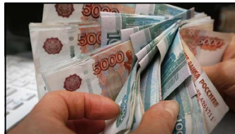
La monnaie russe, le rouble. (Image d'illustration)

occidentales. Les banques centrales des pays émergents, qu'elles soient