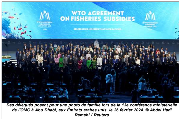
Des délégués posent pour une photo de famille lors de la 13e conférence ministérielle de l'OMC à Abu Dhabi, aux Émirats arabes unis, le 26 février 2024.

merce électronique, exempté de en étant très optimiste, on peinerait