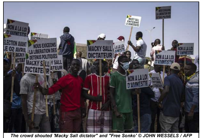
The crowd shouted "Macky Sall dictator" and "Free Sonko"

Senegal was thrown into a political crisis on February 3 when Sall postponed the presidential election planned for February 25. His announcement, denounced as a "constitutional coup d'Etat" by the