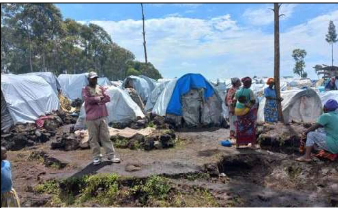
Une vue du site des déplacés de Shabindu - Kashaka, à proximité de la ville de Goma (Nord-Kivu).

appelé, (LUCHA) invite les autorités à pouvoir se soucier de la situation très précaires qui se passe dans l'Est et