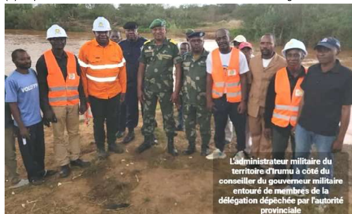
L'administrateur militaire du territoire d'Irumu à côté du conseiller du gouverneur militaire entouré de membres de la délégation dépêchée par l'autorité provinciale

il a promis à la population qu'il va leur construire un marché. [...] Il tient nécessairement à ériger un marché