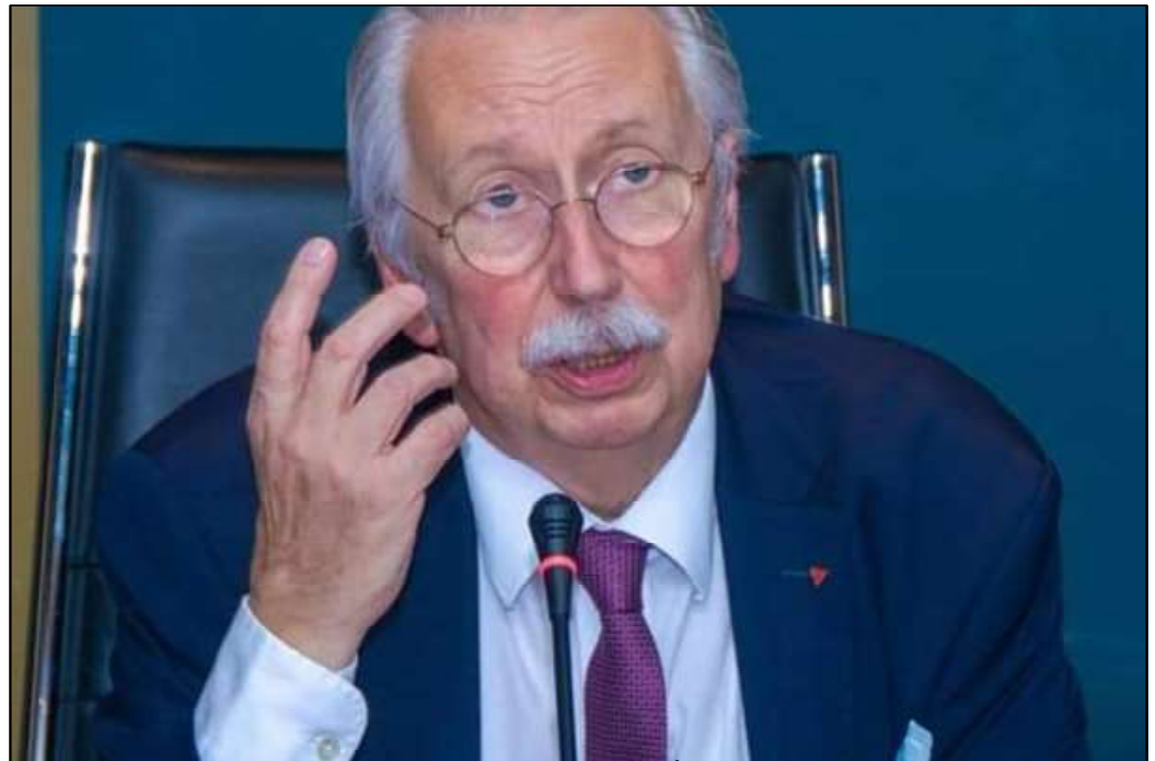
André Flahaut, ministre d'État Belge

belge, pour faire en sorte que l'on ne perde pas de vue le début d'engagement qui ont été pris".