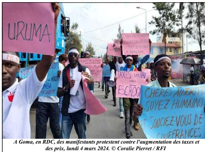
A Goma, en RDC, des manifestants protestent contre l'augmentation des taxes et des prix, lundi 4 mars 2024.

n'y ait la paix, c'est qu'on est en train de voler les paisibles citoyens du Nord-Kivu ", lance-t-il.