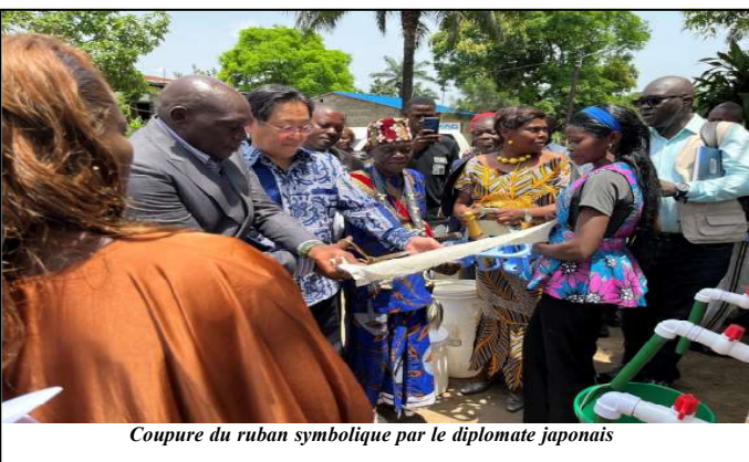
Coupure du ruban symbolique par le diplomate japonais

Pour clore, S.E.M. Ogawa a invité les bénéficiaires à fournir des efforts pour éviter tout gaspillage de l'eau, source de vie, et de veiller à la pérennité du réseau et des bornes fontai-