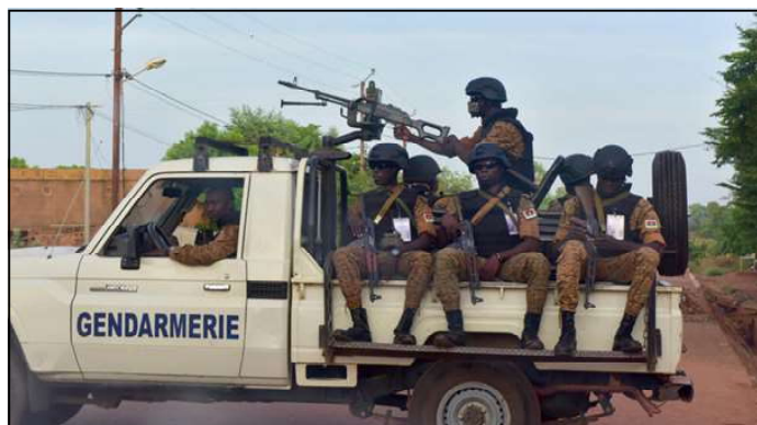
A picture taken on October 30, 2018 shows Burkinabe gendarmes in the city of Ouahigouya in the north of the country where 170 people were reportedly executed on 25 February.

said he received reports of the attacks on the villages of Komsilga, Nodin and Soroe in Yatenga province on 25 February, with a provisional toll of "around 170 people executed".