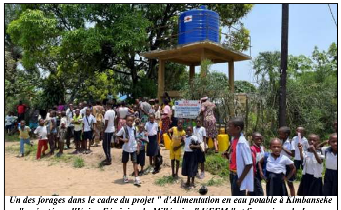
Un des forages dans le cadre du projet " d'Alimentation en eau potable à Kimbanseke " exécuté par l'Union Féminine du Millénaire " UFEM " et financé par le Japon