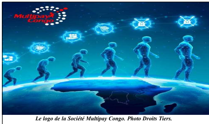
Le logo de la Société Multipay Congo.

qualité et d'innovation, mais également à être en adéquation avec les institutions qui nous gèrent ainsi que la réglementation qui nous gouverne dans le cadre légal ", a-t-il fait savoir.