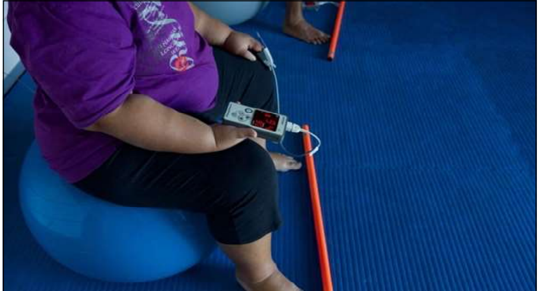
A patient suffering from obesity.