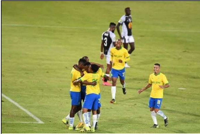
Rencontre entre TP Mazembe et Mamelodi Sundowns, le samedi 02 mars 2022 à Pretoria, dans le cadre de la sixième journée de la phase de groupe de la ligue de champions de la CAF.

Le TP Mazembe s'est incliné (0-1) face à Mamelodie Sundowns le samedi 2 mars. L'unique but de la partie