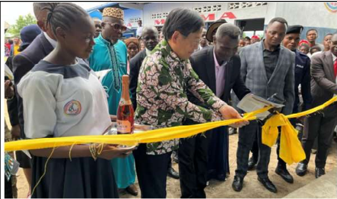
Coupure du ruban symbolique par le diplomate japonais

Commune de Maluku, aux élèves et au personnel de cette école d'assurer l'entretien de ces bâtiments ainsi que des matériels et