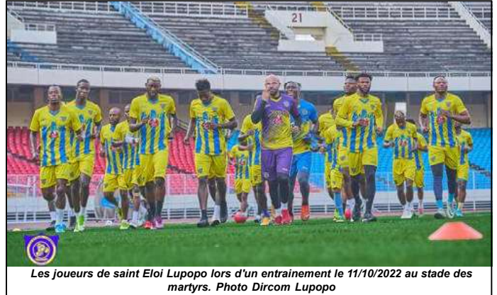
Les joueurs de saint Eloi Lupopo lors d'un entraînement le 11/10/2022 au stade des martyrs.

dans le cadre de la première journée de la phase de play off de la LINAFOOT.