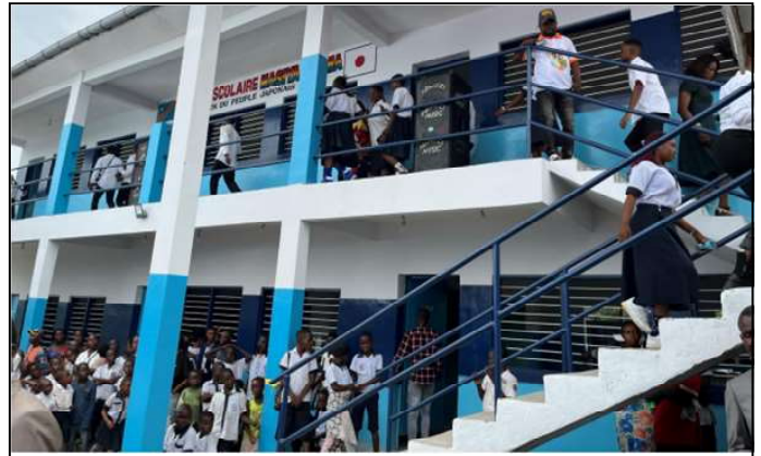
L'Ecole Technique et Professionnelle du Groupe Scolaire Masiya Mbama à Maluku, réhabilitée par le Japon

Projet " d'Extension de l'Ecole Technique et Professionnelle du Groupe Scolaire Masiya Mbama dans la Commune de Maluku " exécuté par l'ONG Génération Active des Opprimés " GAO ".