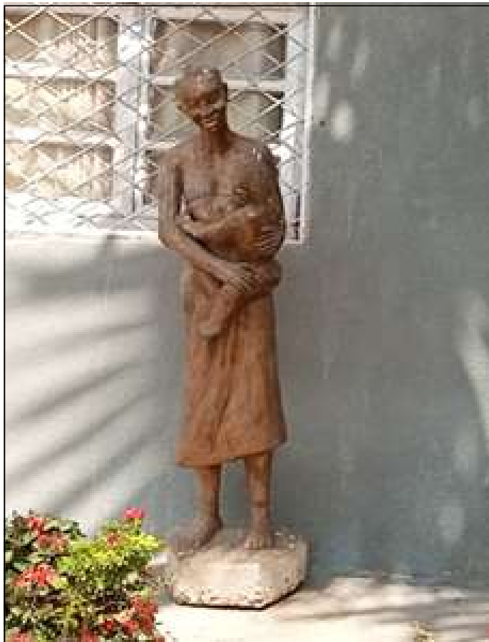
Un nouvel emplacement pour le monument : le mur de la Clinique Saint Gaspard.

Le mot " Femme " y est monotone voire ennuyeux mais