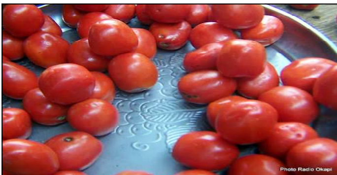
Des tomates en vente au marché central de Beni (Nord-Kivu), 13/11/2016. Illustration

" En premier lieu, c'est le dollar. En deuxième lieu, c'est l'état des rou-