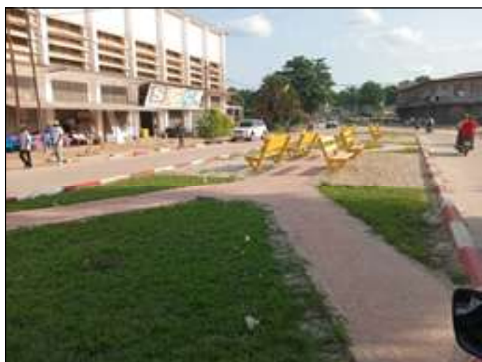
Vue du reposoir placé en lieu et place du Monument dédiée à la Femme.

thème international : " Investir en faveur des femmes : accélérer le rythme ". Le thème national est " Accroître les ressources nécessaires en faveur des femmes et des filles dans la paix pour un Congo paritaire ". Le gouvernement congolais a consacré tout le mois de mars de chaque année aux activités de sensibilisation sur la défense et la promotion des droits de la femme en vue de son accès à la sphère de prise des décisions.