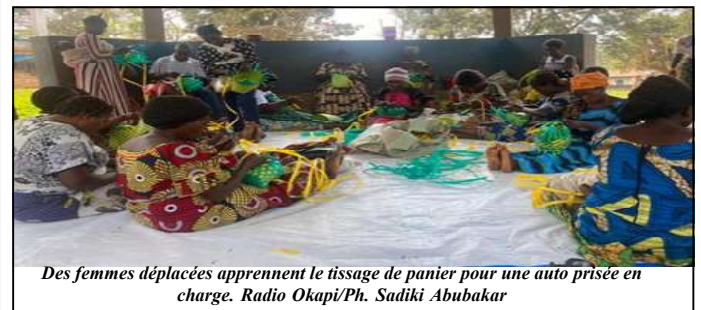
Des femmes déplacées apprennent le tissage de panier pour une auto prise en charge.

" J'ai commencé ce travail à mon arrivée à Beni. D'autres femmes