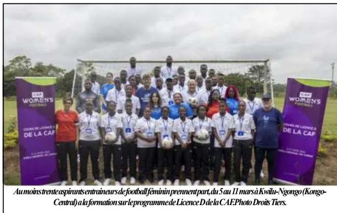
Au moins trente aspirants entraîneurs de football féminin prennent part, du 5 au 11 mars à Kwilu-Ngongo (Kongo-Central) à la formation sur le programme de Licence D de la CAF.

" Nous avons noté les efforts fournis par l'académie locale Kwilu Foot dans toute la région et avons tenu à apporter notre soutien à ses efforts de