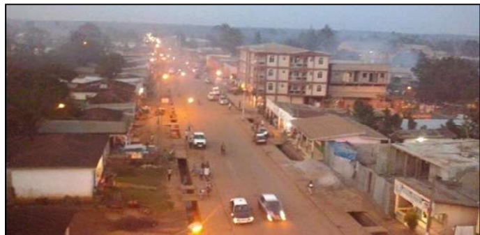
La ville de Ouesso, au Congo-Brazzaville, à la tombée de la nuit, en 2015 (image d'illustration)

Les forces de l'ordre ont tiré des bombes lacrymogènes. Selon une source militaire, un homme grièvement blessé a fait une hémorragie et