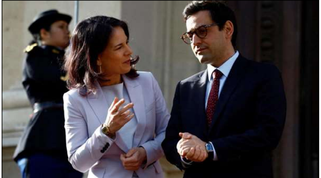
France's Minister for Foreign and European Affairs Stéphane Séjourné and German Foreign Minister Annalena Baerbock prior to an international conference on Sudan at the Quai d'Orsay in Paris on 15 April 2024.

with impact on oil and gold production, affecting a vast region.