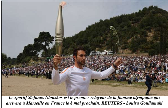
Le sportif Stefanos Ntoskos est le premier relayeur de la flamme olympique qui arrivera à Marseille en France le 8 mai prochain.

notre cœur à tous, nous aspirons à quelque chose qui nous rassemble à nouveau, à quelque chose qui nous unifie, à quelque chose qui nous donne de l'espoir ", a-