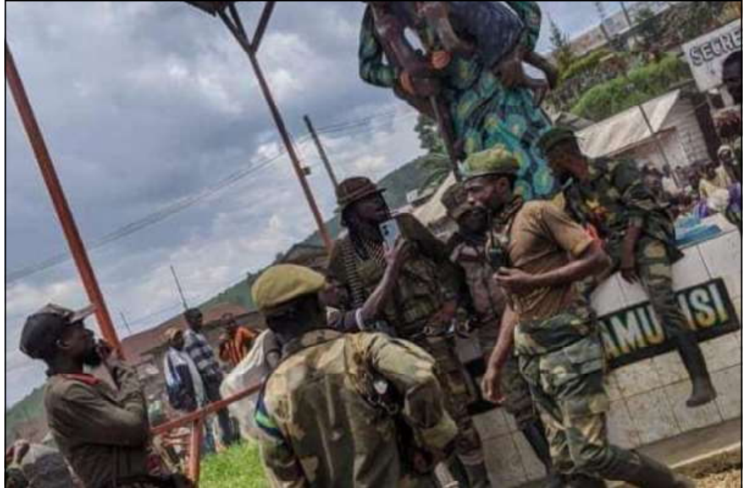
Les défaites face aux rebelles du M23 ont entraîné le repli des troupes régulières et des miliciens wazalendo à Goma, où les incidents se multiplient.