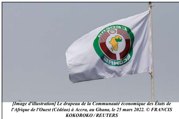
[Image d'illustration] Le drapeau de la Communauté économique des États de l'Afrique de l'Ouest (Cédéao) à Accra, au Ghana, le 25 mars 2022.

lundi l'envoi d'une mission exploratoire faire machine arrière : elle ne parle