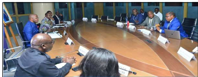
Le ministre des Transports avec les membres de la société Solutech

Selon lui, la somme de 1.428.875 USD qui circule dans les réseaux sociaux relève des estimations transmises par sa société au cours d'une réu-