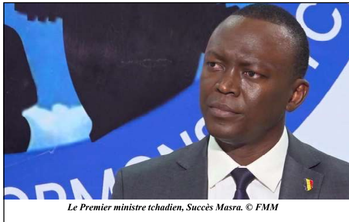
Le Premier ministre tchadien, Succès Masra.

Mais je suis là aussi parce que je représente une force politique, que je considère même majoritaire dans ce pays, et donc nous sommes dans une cohabitation qui ne dit pas son nom. Voyez-vous, je suis là au nom d'une Constitution de la République dont je suis chef de gouvernement, qui me donne des droits et des devoirs, qui donne des droits et des devoirs aussi au président de Transition. C'est une première dans l'histoire de notre pays,