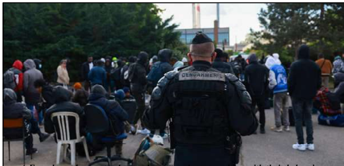
A French gendarme stands guard next to migrants waiting with their belongings during the evacuation of France's biggest squat, which has housed up to 450 migrants, in the southern suburbs of Paris in Vitry-sur-Seine on 17 April, 2024.

At the end of March, residents said they were unable to find accommo-