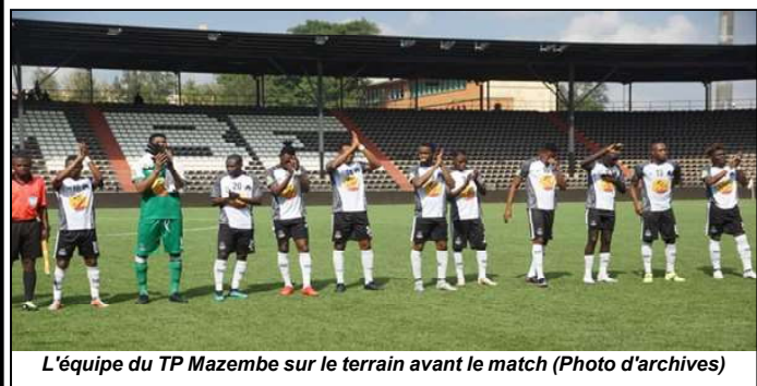
L'équipe du TP Mazembe sur le terrain avant le match (Photo d'archives)

piennat de la Ligue nationale de football (Linafoot), Play-offs. Les Corbeaux du TP Mazembe ont été surpris par le marquage à la culotte des Kamikazes de Lubumbashi Sport dans un derby qui s'est soldé à la mi-temps par un score vierge.