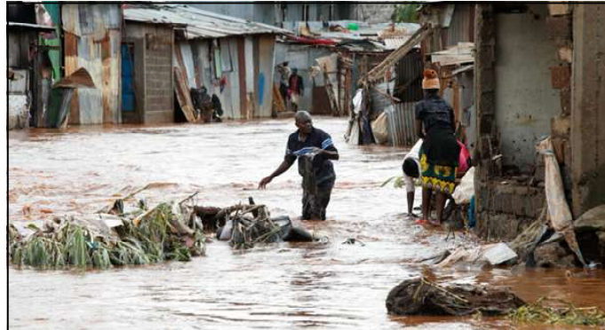
Des habitants de Nairobi tentent de récupérer leurs affaires suite aux inondations au Kenya, le 25 avril 2024. (Image d'illustration)

et habitations informelles. La population avait jusqu'à 18h00, vendredi,