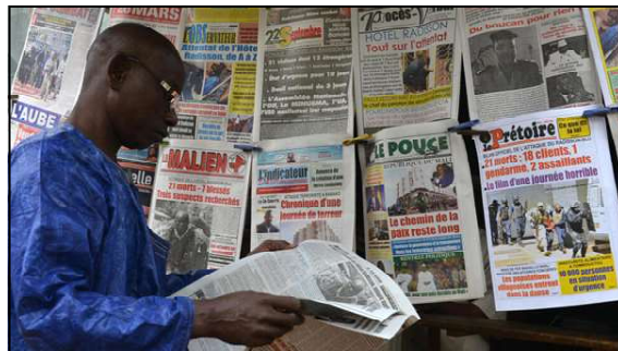
A man browses newspapers at a newsagent's in Bamako, Mali.

For RSF, the Sahel has become one of the biggest black holes for information.