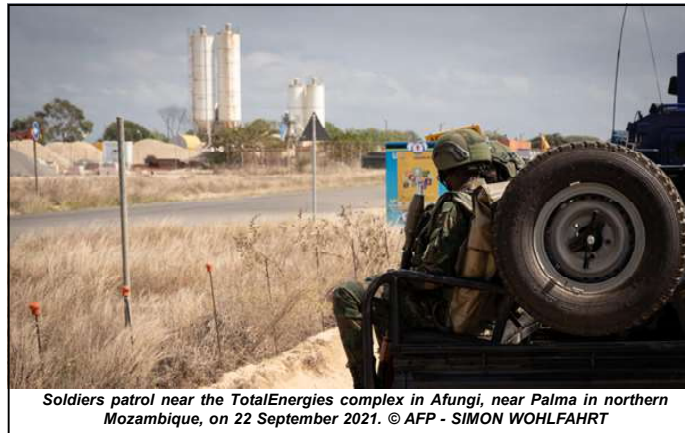
Soldiers patrol near the TotalEnergies complex in Afungi, near Palma in northern Mozambique, on 22 September 2021.

including civilians, staff, contractors and subcontractors. complainants, Henri Thulliez, when they filed their complaint in October