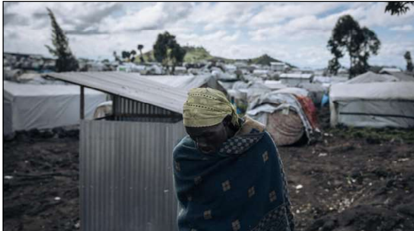
Depuis plusieurs mois, les humanitaires dénoncent la proximité des positions d'artillerie avec les camps de déplacés. Ici, une déplacée dans un camp entre Goma et la ligne de front, le 17 avril 2024. (illustration)

Unies pour l'enfance (UNICEF) condamnent fermement le bombardement, jeudi 03 mai, de trois sites de personnes déplacées, dans les quartiers du Lac-vert, Lushagala et de Mugunga à Goma, au Nord-Kivu, dans l'Est de la République démocratique du Congo.