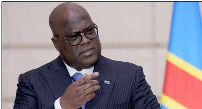
[Image d'illustration] Le président de la RDC, Félix Tshisekedi, lors d'une conférence de presse à l'Élysée, à Paris, le 30 avril 2024.

En République démocratique du Congo (RDC), la Constitution s'est invitée dans le débat. Conformément à cette dernière, Félix Tshisekedi Tshilombo a été réélu pour un second et dernier mandat en décembre 2023. Mais ces derniers jours, lors de rencontres avec la diaspora en Europe, le président congolais ne s'est pas montré fermé au débat sur la révision de la Constitution.